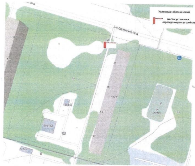
Рис.1 – Схема размещения ограждающего устройства